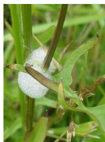
Crachat de coucou