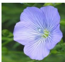
Fleur de lin

Les voici pour souvenir (liste non exhaustive) :